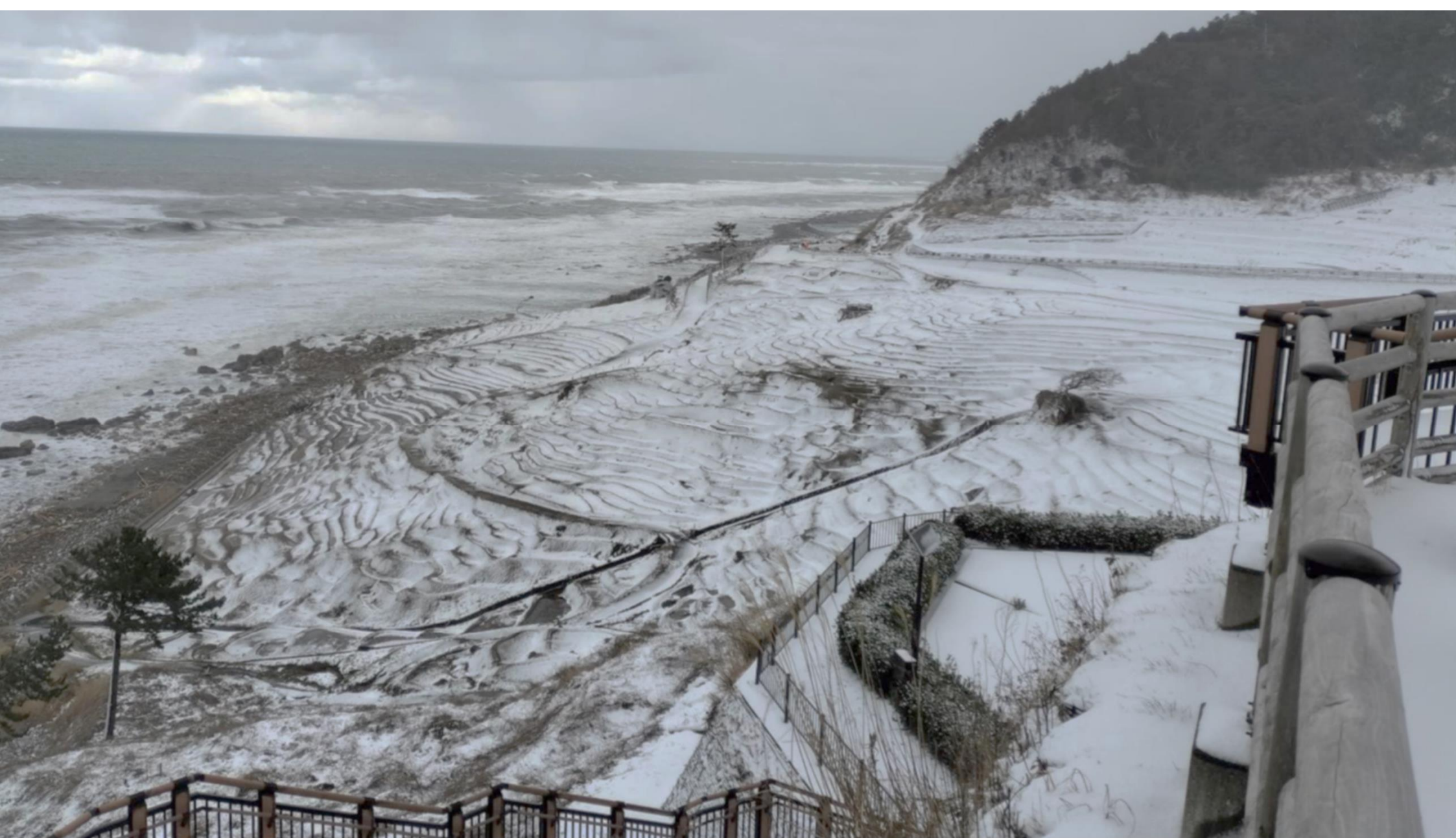
道の駅 千枚田 ポケットパークより「白米千枚田」を望む（2月6日）